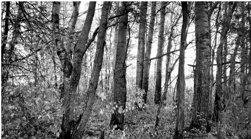
Старые осины, высаженные в ряды, выдают дорогу к церкви

20 апреля 1880 г. в списках священнослужителей Полоцкой епархии, удостоенных Высочайших наград «за отлично-усердную службу по епархиальному