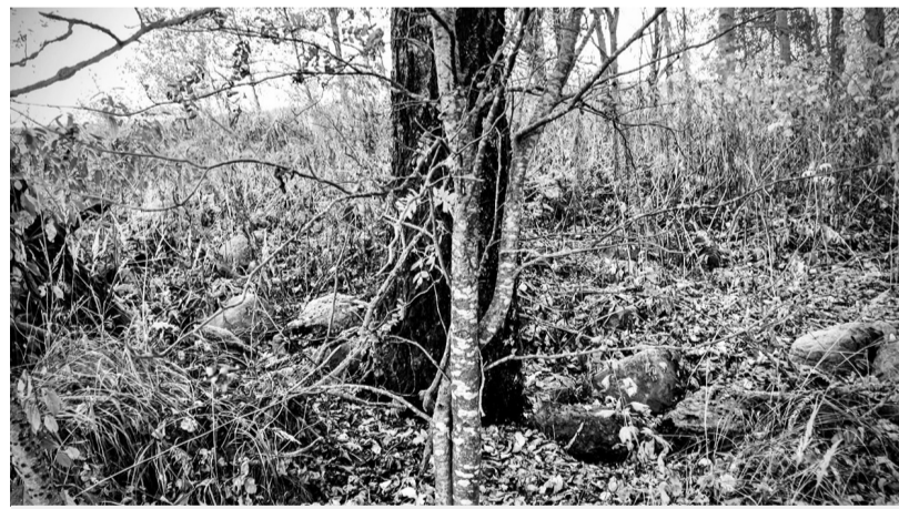
Место фундамента и все, что от него осталось

После Его Преосвященство осмотрел церковную утварь и ризницу, секретарь изучил письмоводство. Затем Владыка вышел из алтаря и благословил каждого из присутствовавших, а священники раздавали народу крестики и листки религиозно-нравственного содержания. При раздаче крестиков местный хор из любителей и любителейниц дружно исполнял разные песнопения. Это было одно из самых больших событий того времени в истории Селищенской волости, когда собралось столько людей. Позже белорусский писатель Игнат Дубровский в своей книге «Да долі чалавечай» вскользь напишет про это событие: «Самым ярким событием было, когда в 1924 году в коммуну (коммуна «Красное Знамя» в д. Долгополье) пришел новый трактор, советский «Путиловец». Чего только люди не видели на этих землях, но увидеть первый трактор было самым большим чудом здесь. Даже, когда в Селище на кирмаш приезжал с Ви-