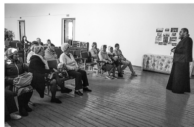
Встреча членов клуба "Светоч"

милы для нового храма был написан образ в честь Успения Пресвятой Богородицы, освященный в день праздника. Святой образ сейчас находится в сельской библиотеке. Об уникальности и святости Вировлянской церкви говорит её история. Во все времена, даже самые острые для верующих – времена становления советской власти, церковь продолжала функционировать, принимая большое количество верующих. Сюда шли по важным событиям: будь то рождение, бракосочетание или смерть, здесь лечили душу и находили успокоение люди, жившие некогда в этих местах в самые разные времена. Сюда собирались на ярмарки, церковные праздники, поминали усопших, крестили детей. Преодолевая множество сопротивлений, рискуя порой своей свободой, люди этих мест отстаивали и возвращали храм, а с ним свою веру, свои традиции, свою историю. Потому вопрос о возрождении церковной жизни на Вировлянской земле получил широкий отклик и сегодня в сердцах людей.