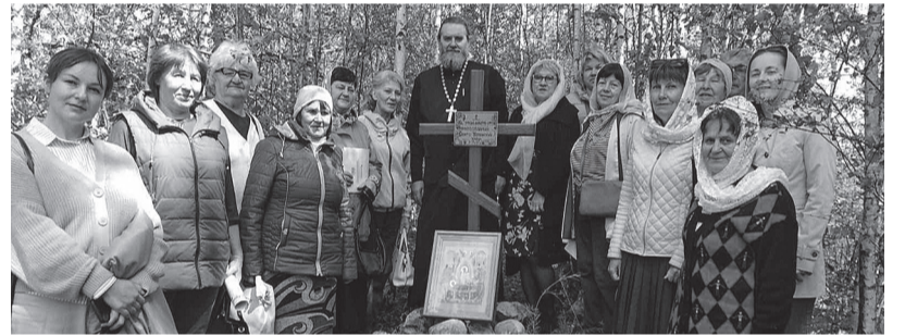
После молебна на месте где стоял храм

Пока жили наши старики, все это жило вместе с нами, а когда их не стало, всё ушло. Поэтому так важно нашим детям, пока их головы ещё светлые, а память детская цепкая, вложить им важность сохранения истории семьи и ее традиций.