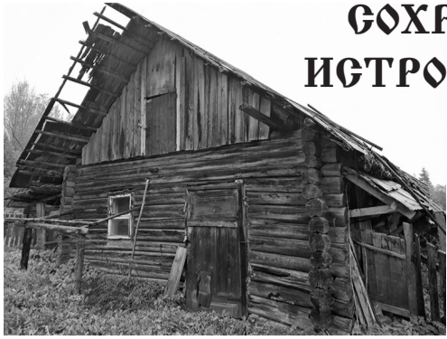
Дом в д Рудня 2023 год

Просим вашего участия и помощи в сохранении культурно-исторического наследия нашего края, воссоздании дома, в котором жил с семьей святой священномученик Афанасий Прихабский в д. Рудня, Городокского района. Священномученик Афанасий родился в 1880 году в д.Тараскино Себежского уезда, Псковской губернии в русской крестьянской семье. В 1910-1916 гг. служил диаконом в церкви д.Сиротино Витебского уезда. В 1918-1924 гг. - в церкви д.Хвошно, Городокского уезда. В 1924 году Афанасий был посвящен в пресвитерский сан архиепископом Иннокентием и назначен настоятелем в храм преподобной Ефросинии Полоцкой в д. Рудня, где служил до 1929 года. Из-за сильного давления властей в 1930 году ему пришлось с семьей переехать в село Прихабы Себежского района, Псковской области, где он служил в Никольском храме. В апреле 1935 года его арестовали во время пасхального богослужения. 23 августа 1937 года Особой тройкой при УНКВД