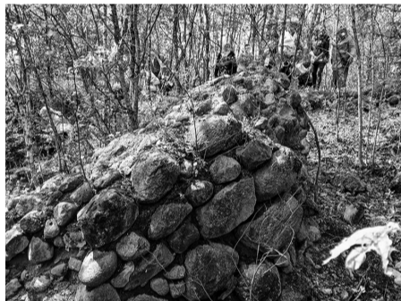
Остатки фундамента храма