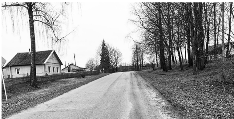
Это улица, или место, называемое Поповщина. Ранее здесь проживал батюшка.

Считается (или говорят), что когда построен и освящён храм, на том месте на веки вечные стоит Ангел. Он хранит эту святыню. Если бы мы сегодня жили той чистой, простой детской верой, которой наделил нас Господь, то Ангел поведал бы нам о том, как