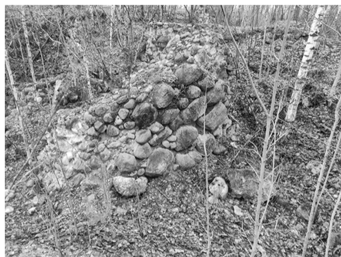
Это сохранившиеся камни фундамента. Подвалы Храма были глубокими. Камни совсем не маленькие.

Духовная жизнь постепенно возрождалась. Приход состоял из 7891 человека! В храме был свой штатный священник. Существовала детская церковно-приходская