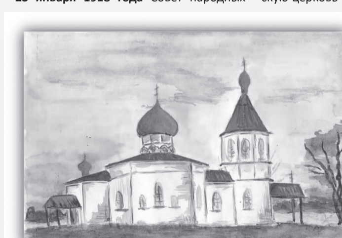
Репродукция храма во имя Покрова Пресвятой Богородицы в селе Вышедки, созданная учащимися по документальному описанию

комиссаров РСФСР издаёт Декрет №263 «Об отделении церкви от государства и школы от церкви». В этом документе был подтвержден запрет на финансирование церковных учреждений государственными органами власти. Не допускались принудительные (т.е. обязательные) сборы и обложения в пользу церковных и религиозных обществ. Декрет вообще лишил приходскую общину права владеть собственностью, причем не только храмовое здание и приходские постройки, но и церковная утварь переходили в иную форму собственности, становясь «народным достоянием».