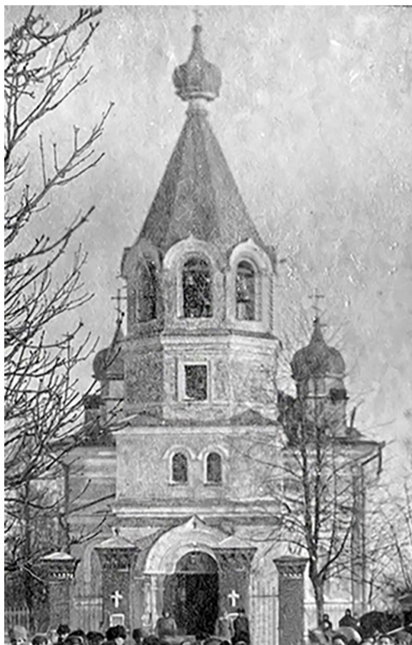
Храм в честь святителя Николая на месте РОВД

Одновременно с восстанием в Городке произошли контрреволюционные выступления в волостях Городокского уезда: Вышедской, Веречской, Горковской, Зайковской, Руднянской, Межанской. В ходе расследования в 1933 г. свидетели событий указывали, что все выступления возглавлялись и частично управлялись «церковниками» при непосредственном участии и поддерж-