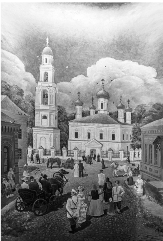
Реконструкция Никольского собора, городокский краеведческий музей