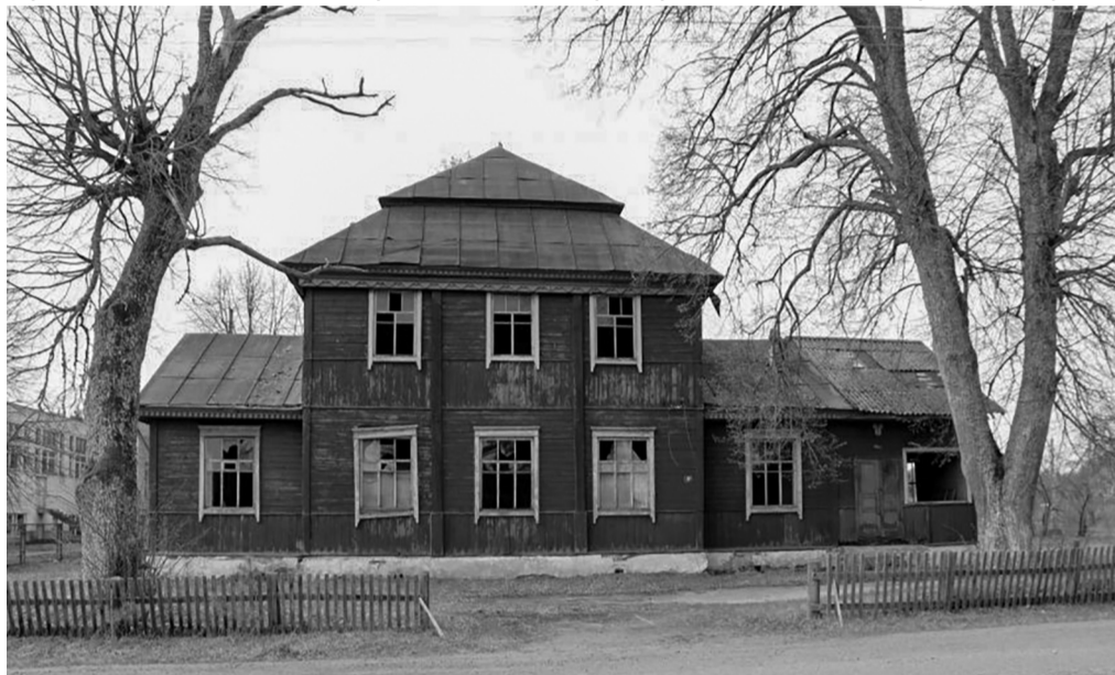
Бывшая церковь Николая Чудотворца в Веречье.

Об истории Вереченской Николаевской церкви можно сообщить, что она построена в 1862 году. Материал для нее брали с Вереченской казенной дачи. Фундамент был каменным, внутри брёвна обтёсаны и обструганы, снаружи церковь обшита досками, крыша покрыта дранкой, один из куполов над средней частью, над входом с крыльцами покрыт железом. Над двумя куполами кресты обиты белой жемчужной краской, церковь имела 8 больших окон с наличниками, 7 четырехстворчатых дверей. Потолок был подшит тесом. Снаружи стены, оконные переплеты были покрыты охрой, крыша – чернядью, два купола и маковка над колокольней – медной краской. Иконостас