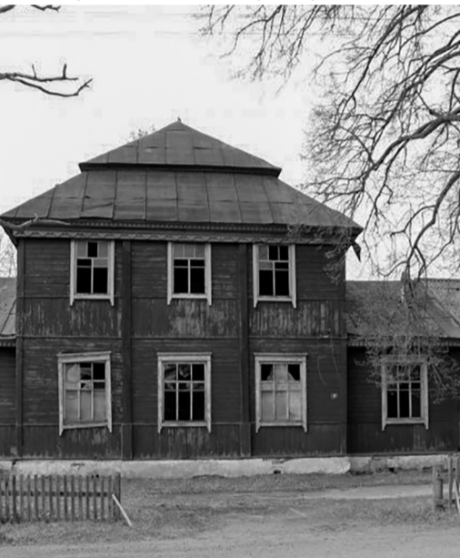
Бывшая церковь Николая Чудотворца в Веречье.

ра Покровского, освятили её во имя Успения Богородицы. В документах приёмки записано: «Построена прочно и хорошо из материалов соответствующего качества». Использовано было 7 тысяч 372 рубля 49 копеек. Прихожан в церкви было 1 тысяча 995 человек, среди них 15 старообрядцев.