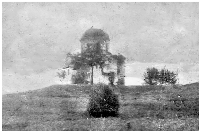
Сохранившееся изображение Хвошнянской Свято-Вознесенской церкви.

Хвошнянская Свято-Вознесенская церковь была построена в 1807 году, в ее спустя год насчитывалось 3 тысячи 61 человек. Она была каменная на каменном цоколе, крыша покрыта железом, снаружи и внутри побелена. Длина постройки-6 сажень 1 аршин. Колокольня была двухъярусной.