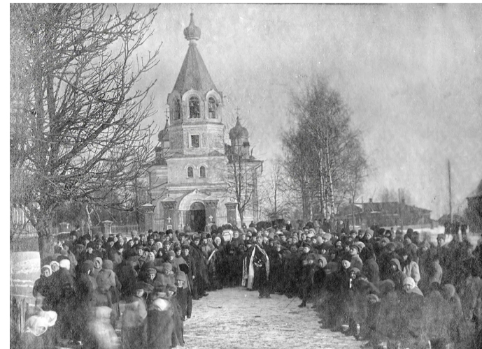
Одно из немногих сохранившихся изображений «тёплого» храма на месте РОВД (сведения о названии разнятся, люди его называют в честь святителя Николая).

живописное 5-куполье под жестяной крышей и маковкой над колокольней, на которой висели 5 колоколов весом от 3 до 100 пудов. Стены членились 12-ю оконными проемами. Ценностями этой церкви были серебряный позолоченный, украшенный эмалью, крест, серебряные потиры, звездича, ложечка, тарелочка, даросберегательница... В этой церкви находилась икона Александра Невского (длиной 1/4 аршина) в серебряной ризе, над царскими вратами – икона Параскевы Мученицы (длина 3 вершка). Над правым клиросом, в киоте – иконы Николая Чудотворца и Неопалимой Купины под серебряными ризами. Рядом с церковью в 1903 году было построено церковно-приходское училище. Фундамент и стены его составили часть современной церкви.