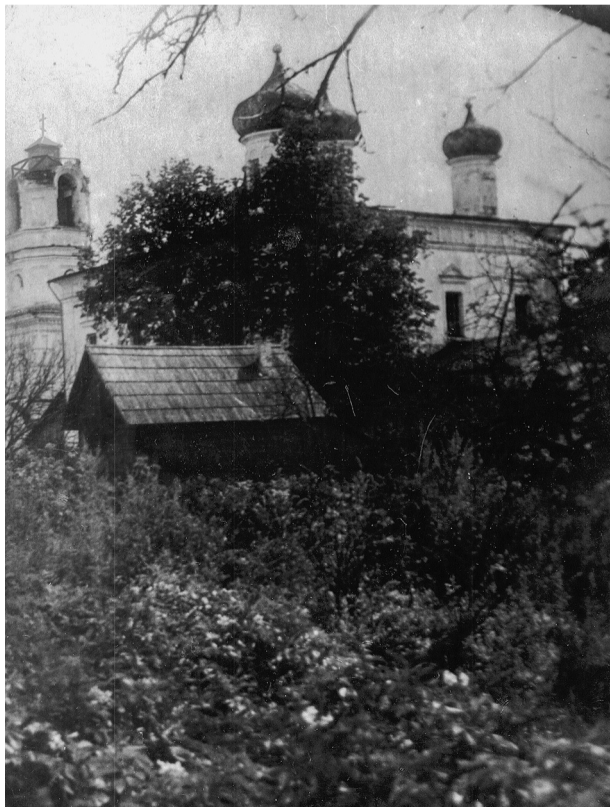
Вид на собор Святителя Николая со стороны Интернациональной улицы, так называемой «каменки».