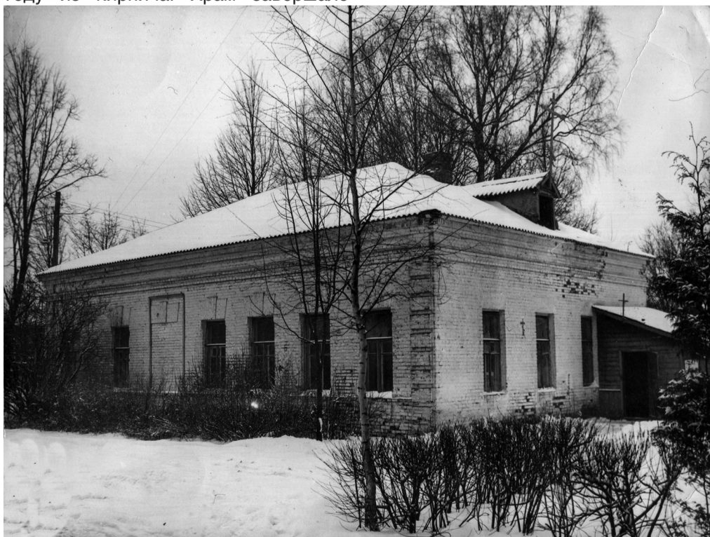
Так начиналась Свято-Троицкая церковь. Заходили в неё сзади, сейчас на этом месте алтарь. Мы видим над дверью деревянный крест, указывающий, что здесь вход в храм.